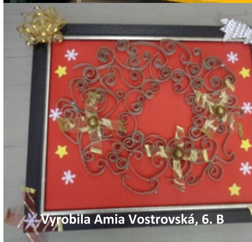
Vyrobila Amia Vostrovská, 6. B