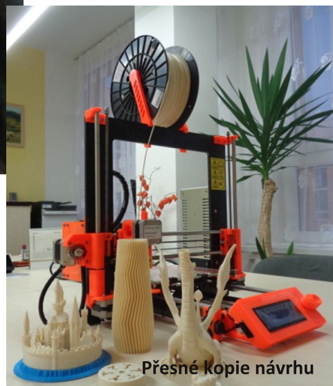
Přesné kopie návrhu