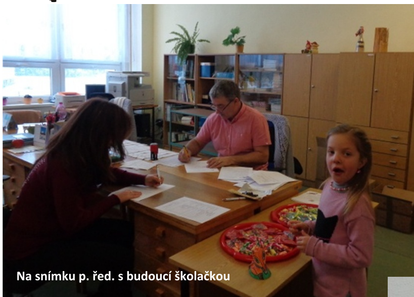
Na snímku p. řed. s budoucí školačkou

15. 1. a 16. 1. 2016 se konal zápis do prvních tříd. Některé třídy a i naše 7. A vyrobily dárečky pro budoucí prvňáčky. My jsme udělaly domečky, které vypadaly jako škola.