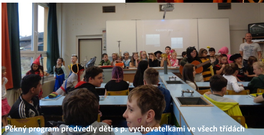
Pěkný program předvedly děti s p. vychovatelkami ve všech třídách