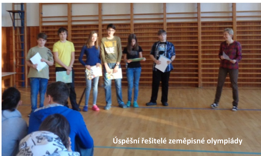
Úspěšní řešitelé zeměpisné olympiády