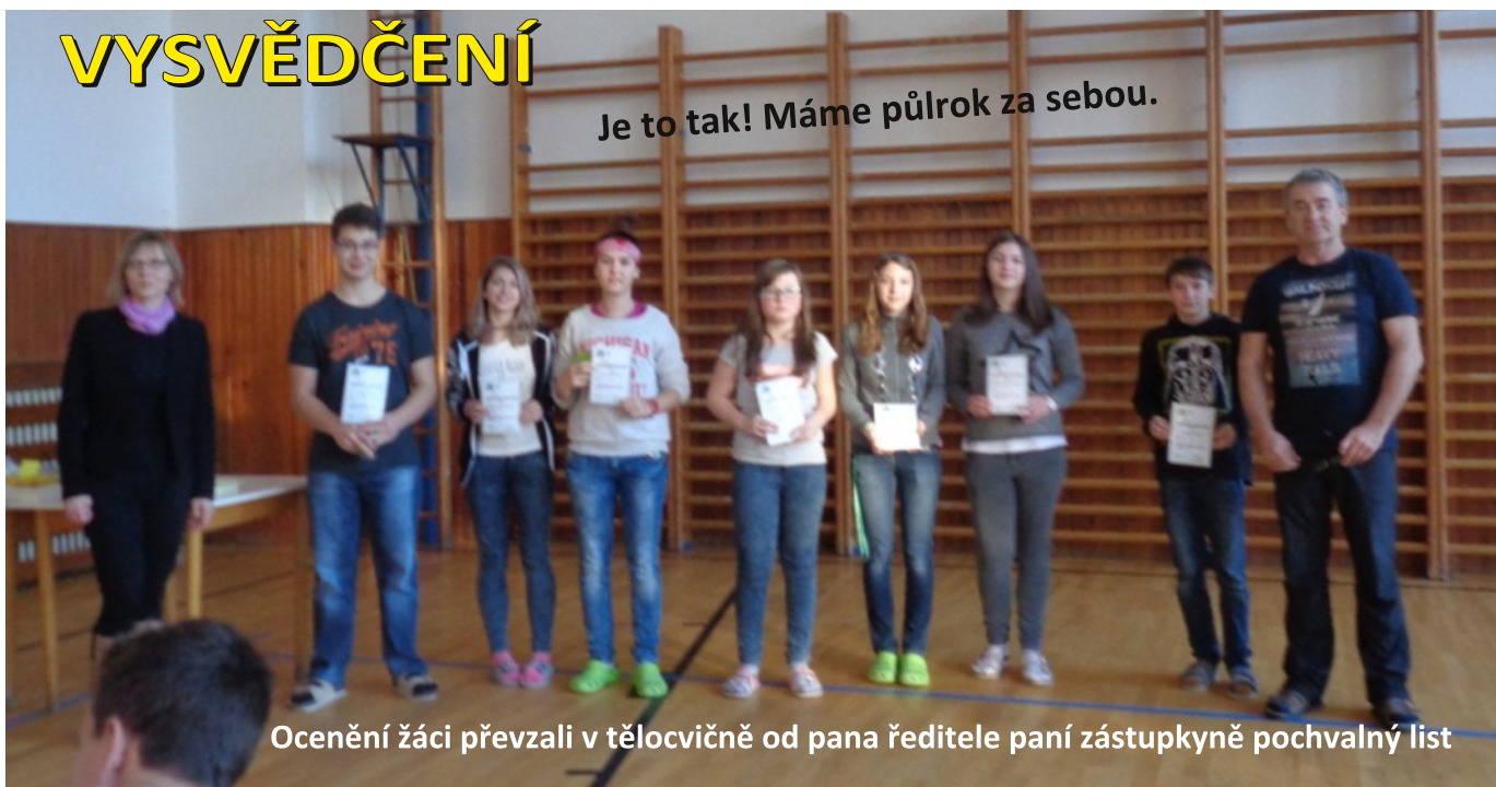
Ocenění žáci převzali v tělocvičně od pana ředitele paní zástupkyně pochvalný list