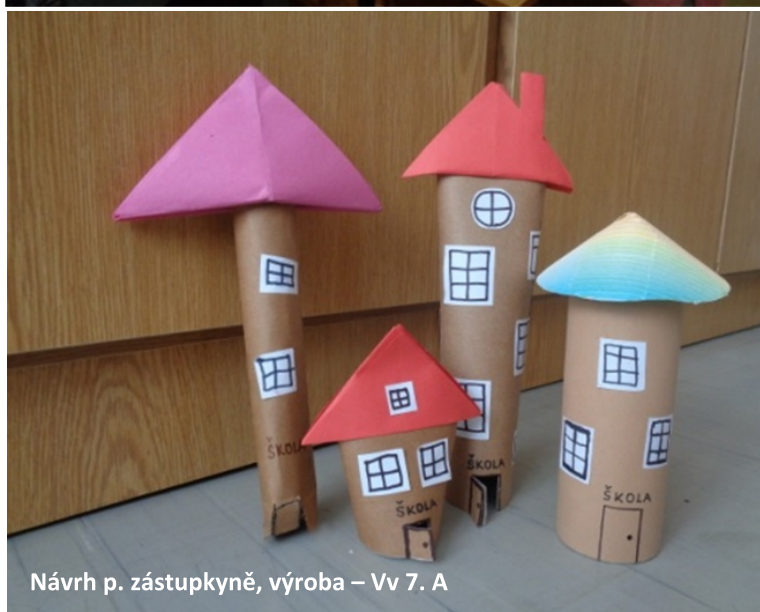
Návrh p. zástupkyně, výroba – Vv 7. A