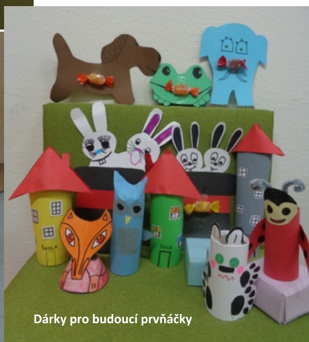
Dárky pro budoucí prvňáčky